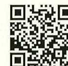
三島市ホームページ

接種予約をされる方の 接種券番号・生年月日 をご用意ください。 （接種券番号は、予診票右上または予防接種済証（臨時接種）に記載されています）